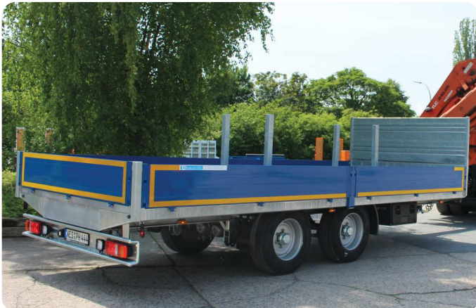
Tandem-Pritschentieflader von 5t bis 14t Gesamtgewicht – maßgeschneidert für den Gerüstbau und Baustofftransport