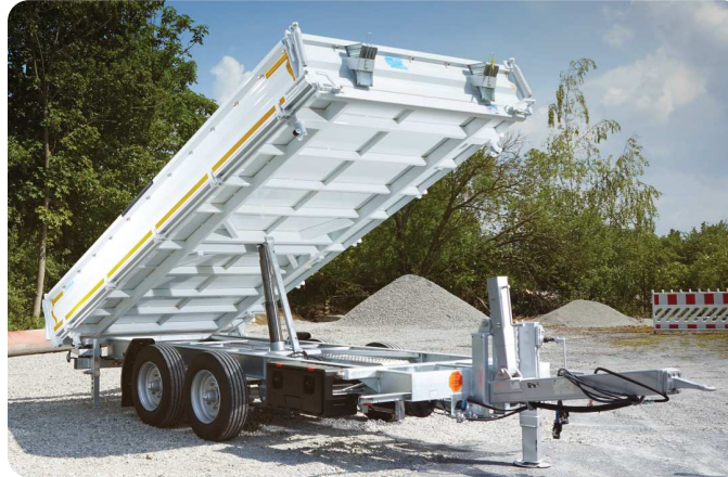
Tandem-Dreiseitenkipper u. Tieflader von 5,0t bis 19t Gesamtgewicht – der Alleskönner für Ihren Fuhrpark