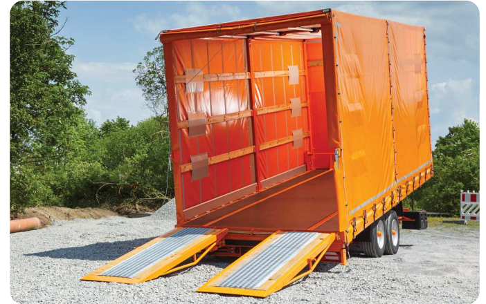
Fahrgestelle / Sonderfahrzeuge – Sonderkonstruktionen auch in Einzelanfertigung