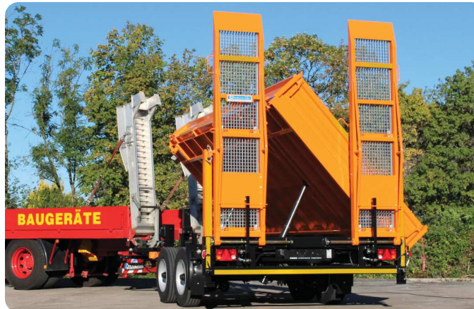
Tandem-Zweiseitenkipper von 10,5t bis 19t Gesamtgewicht – der komfortable Allrounder