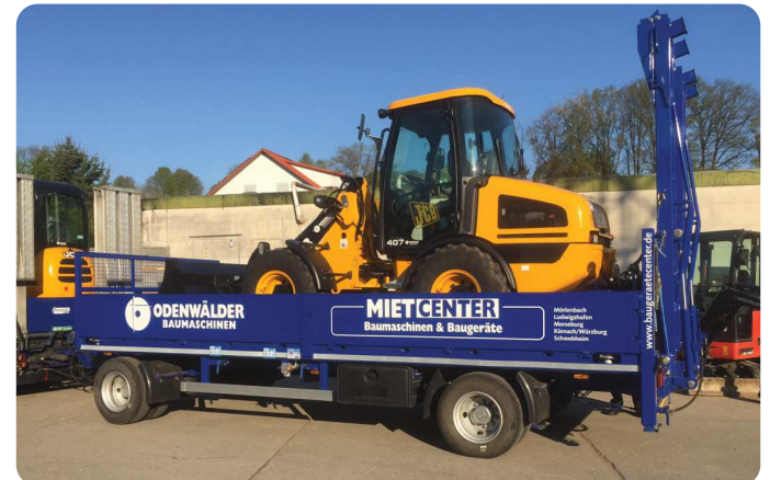
Zweiachser von 12t bis 18t Gesamtgewicht – unser robuster Lastenträger für Ihre Ladung