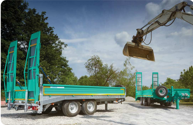
Tandem / Tridem-Überfahrtieflader von 5,0t bis 25t Gesamtgewicht – das Multitalent am Bau